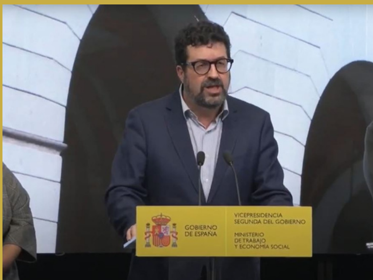
Video: Trabajo logra un acuerdo con CCOO y UGT para ampliar los permisos por duelo sin CEOE