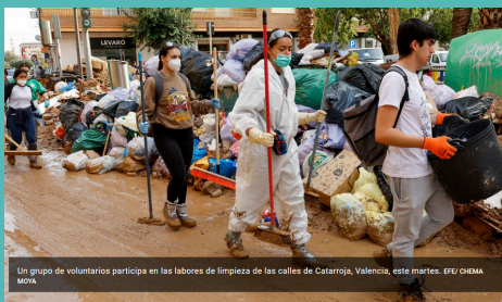
Un grupo de voluntarios participa en las labores de limpieza de las calles de Catarroja, Valencia, este martes.

La mayoría de los casi 40 voluntarios que forman la plataforma son valencianos, pero hay gente de toda España. Este grupo de personas voluntarias, antes desconocidos, hacen reuniones a diario para organizar su funcionamiento sin ayuda de ninguna organización oficial.