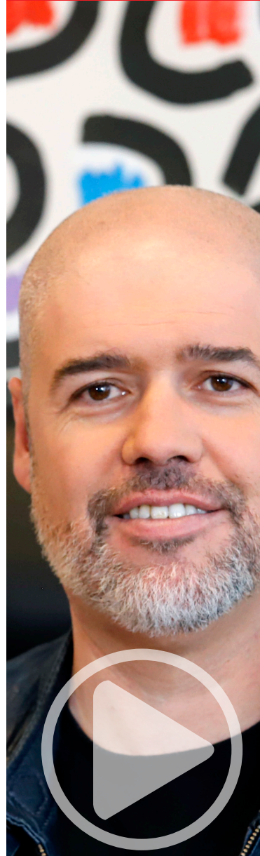
Unai Sordo Secretario general de CCOO

Asimismo, está sobre la mesa de diálogo social otras propuestas igualmente relevantes, como el destope de las bases máximas de cotización, lo que posibilitaría una mejora de ingresos de unos 7.000 millones €/año.